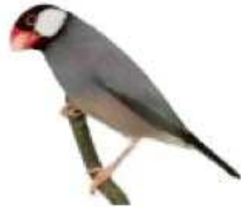
Kweeksoort: Kanaries, Rijstvogels

A. Stolk Grote Watering 10 3209 AX Hekelingen 0181-631853 Kweeknummer G123